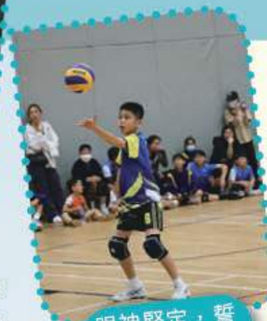
眼神堅定，誓要發好球