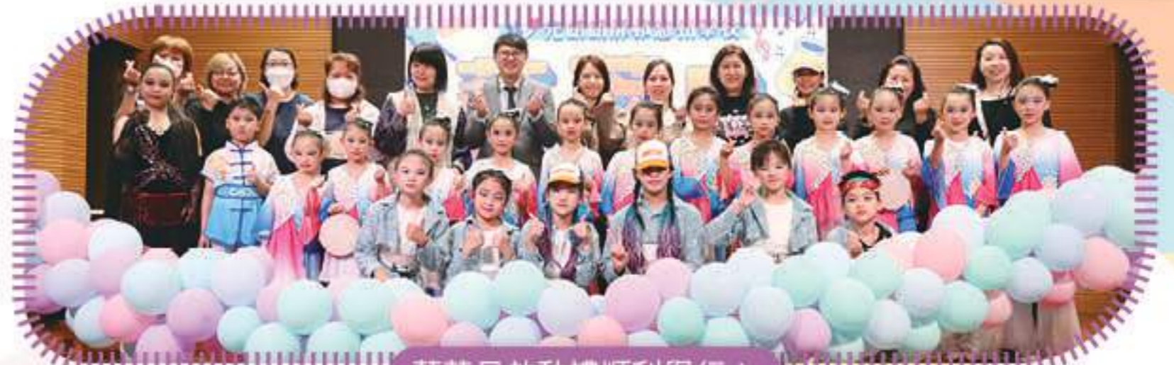
藝萃日啟動禮順利舉行！