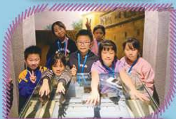
惠州博物館讓我們眼界大開！

惠州交流團中，本校同學與李瑞麟小學的師生進行交流，親身體驗了內地學生的上課模式，擴闊了眼界。除此之外，同學們還遊覽了西湖和惠州市博物館，藉此機會認識了不少惠州當地的歷史和文化。