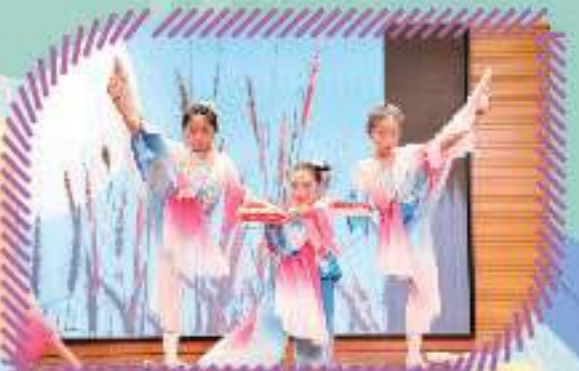
啟動禮表演—中國舞