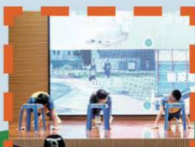
學生體驗考核體能要求