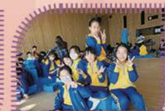
這是一個既愉快，又充滿樂趣的製作過程啊!