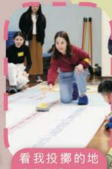
看我投擲的地壺有多遠！