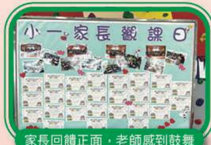
家長回饋正面，老師感到鼓舞