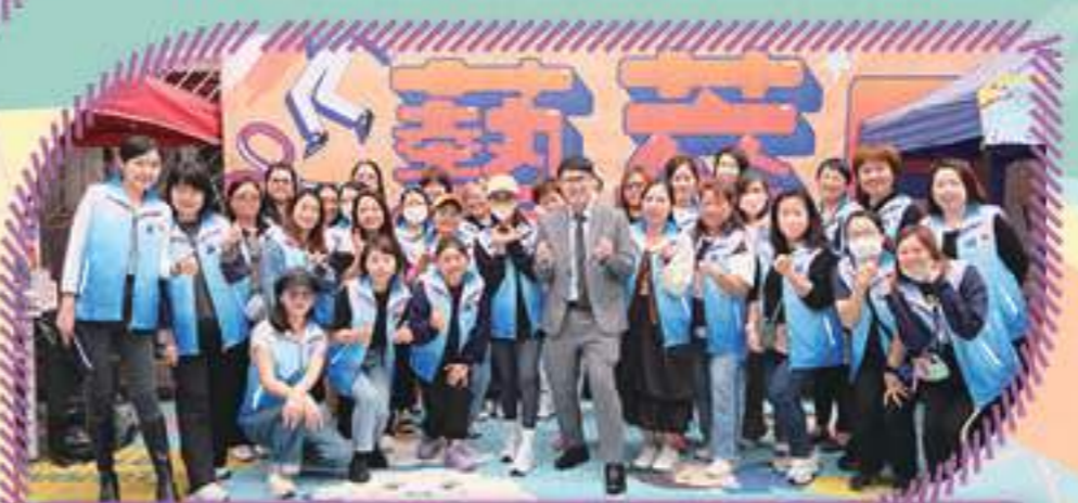
陣容強大的藝術家長義工，負責主持藝術攤位

除了藝術家到校表演，本校30多位「藝術爸媽」家長義工擔任藝術攤位主持人，與學生同創同樂，以藝術促進家校合作。