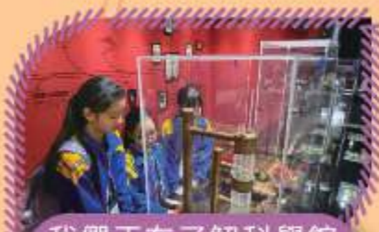
我們正在了解科學館內的各種實驗裝置