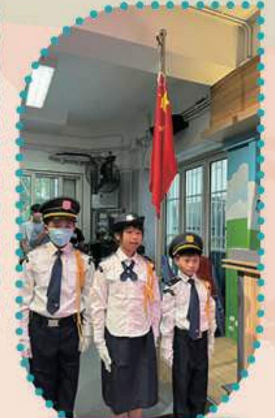
英氣的升旗隊隊員