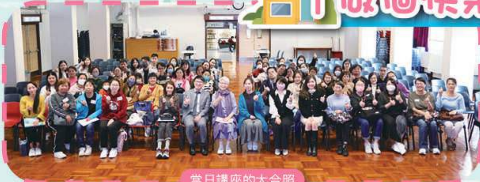
當日講座的大合照

家教會於2023年12月16日家長日期間順利舉辦了「做個快樂父母」家長教育講座，邀請著名演藝人陳敏兒女士擔任主講嘉賓，向家長分享有關管教子女的有效策略及實例分析，幫助父母打造快樂育兒的教育方式。