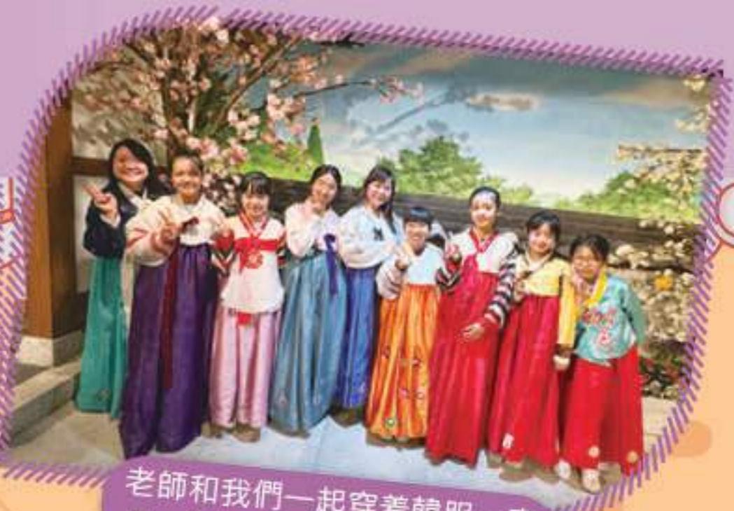
老師和我們一起穿着韓服，真是一個難忘的體驗！