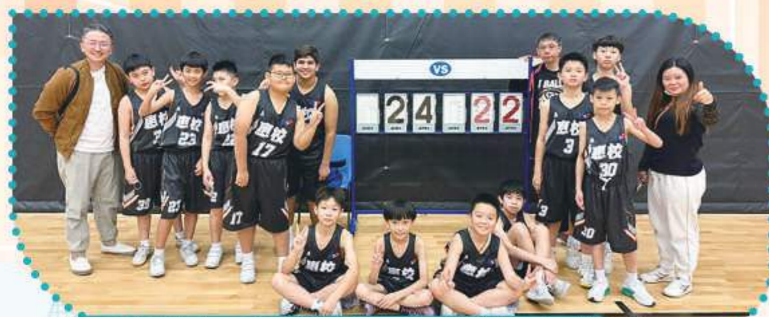
同學們的努力，家長們的支持，籃球隊勝出漂亮一仗