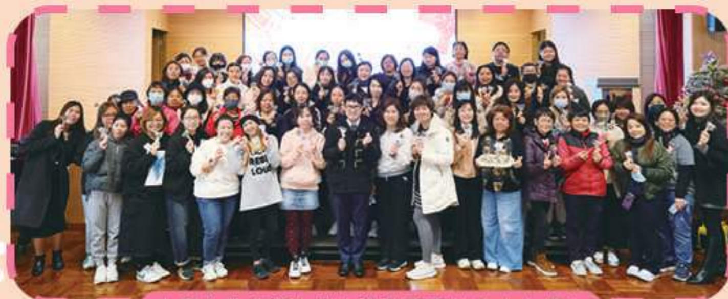
大家為全校師生送上甜甜蜜蜜的朱古力棒！

家教會於2023年12月19日順利舉辦「聖誕朱古力DIY班」，活動當天在家教會主席及家長義工的協助下，家長們親自製作愛心朱古力棒，除了把製成品帶回家與家人品嚐外，也特意送贈給惠校的教職員，全校一同分享佳節的歡樂。