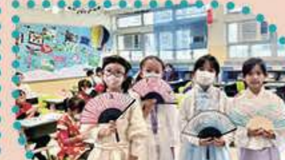
我們都穿了漢服回校呢！