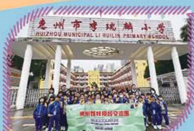
我們與惠州市李瑞麟小學的師生進行交流