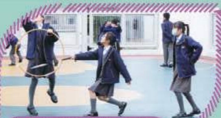
大家都很享受拍攝過程，十分投入呢！