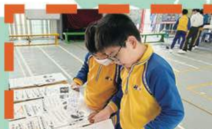
欣賞價值教育學習冊佳作