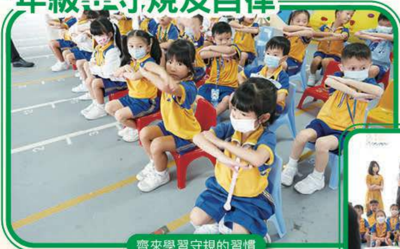
齊來學習守規的習慣