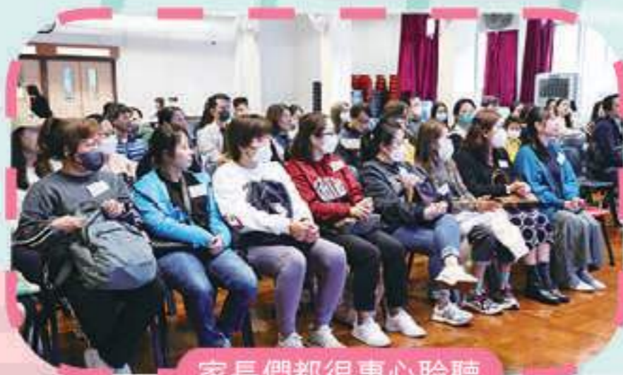
家長們都很專心聆聽

家教會於2023年12月16日家長日期間順利舉辦了「做個快樂父母」家長教育講座，邀請著名演藝人陳敏兒女士擔任主講嘉賓，向家長分享有關管教子女的有效策略及實例分析，幫助父母打造快樂育兒的教育方式。