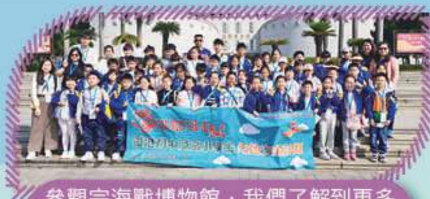
參觀完海戰博物館，我們了解到更多有關近代中國的歷史啊