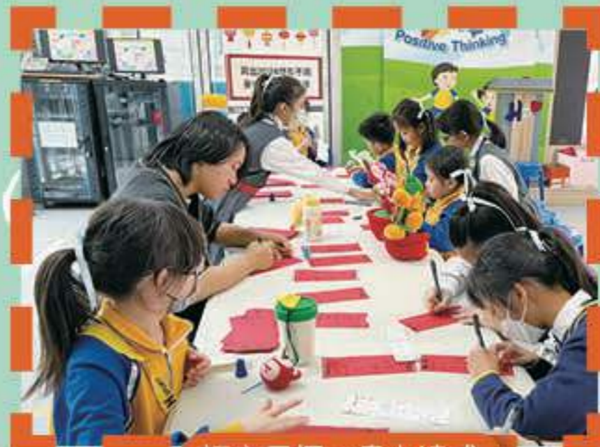
訂立目標，盡力達成