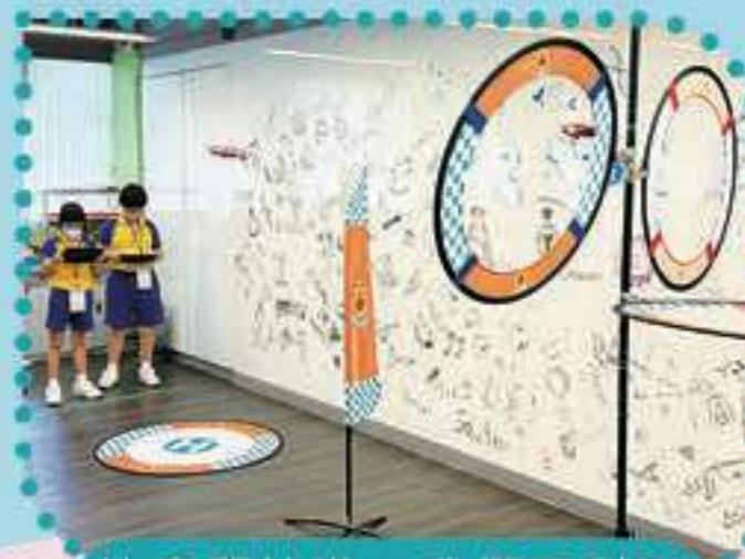
比賽開始啦！我們要利用無人機越過障礙