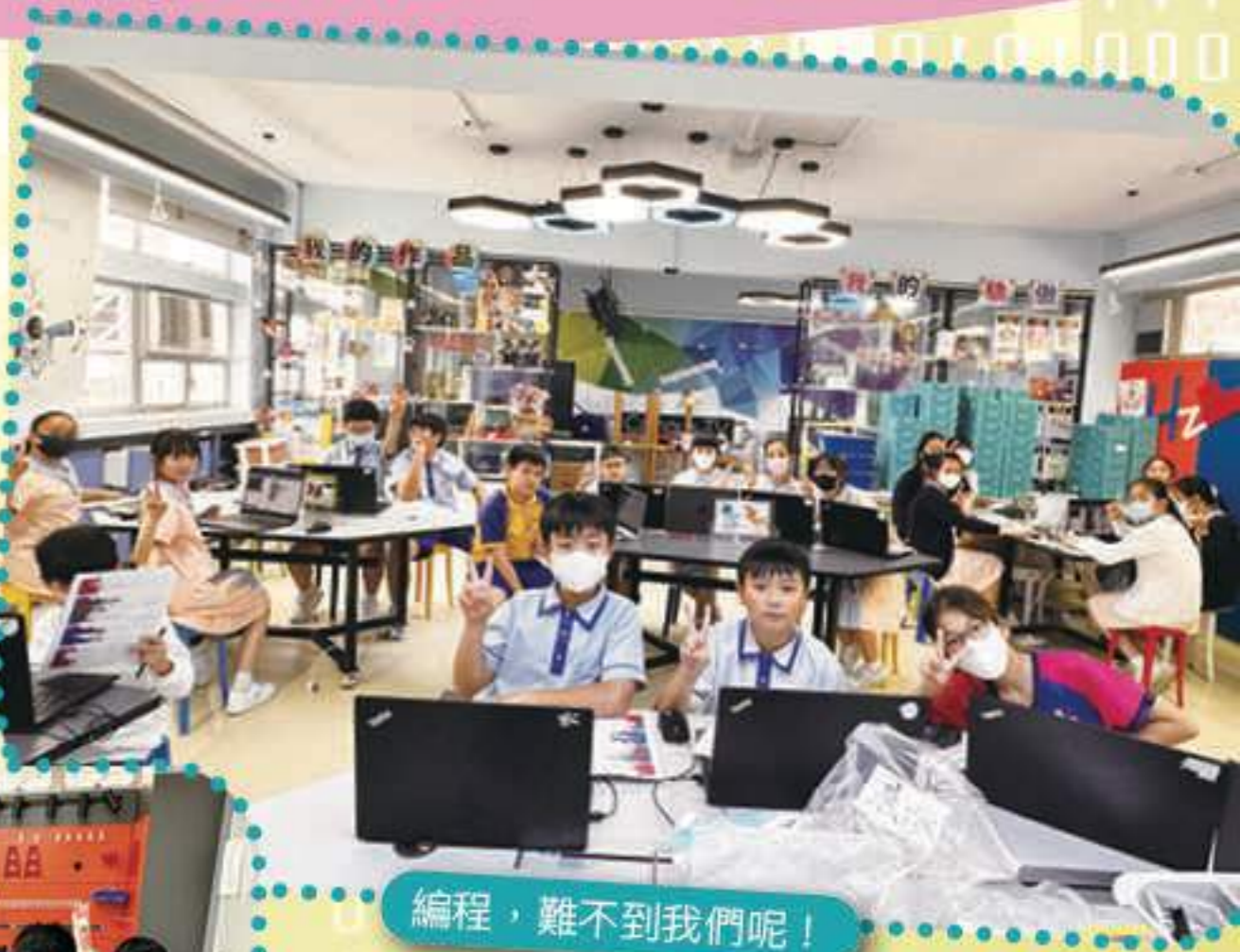
編程，難不到我們呢！

這過程不僅提升了學生的邏輯思維和解難能力，更激發他們對程式設計和比賽的興趣，於本年度參與多個編寫應用程式的比賽，豐富自己的學習經驗。