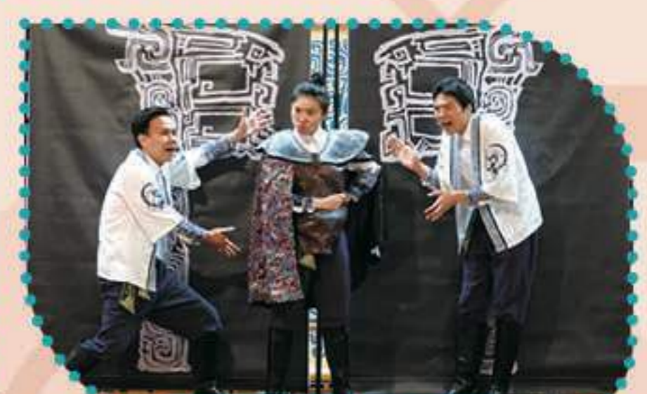
演員們帶來精彩的表演