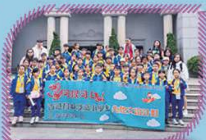
我們準備參觀孫中山紀念館