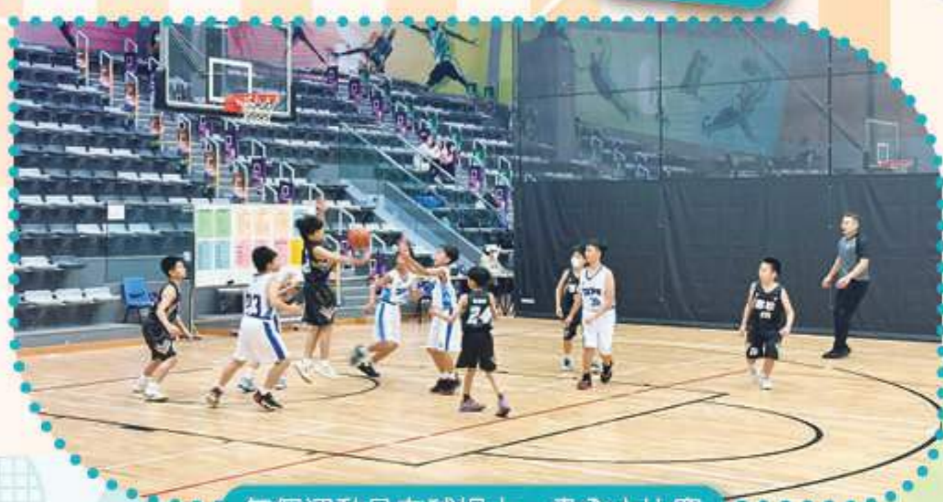
每個運動員在球場上，盡全力比賽