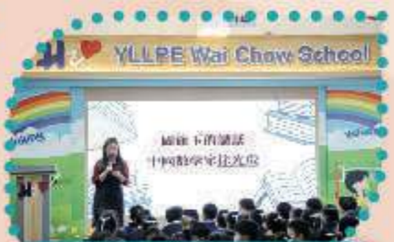
學習中國數學家徐光啟堅毅的精神