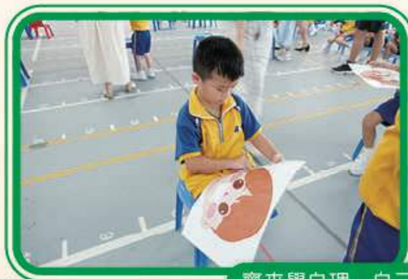
齊來學自理，自己穿校服，自己洗臉