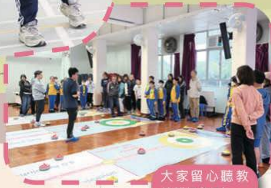
大家留心聽教練講解規則

家教會於2024年3月9日順利舉辦「親子新興運動同樂日」，安排了專業運動教練到校進行新興運動體驗，項目包括有地壺球、芬蘭木球和布袋球，家長與學生在教練指導下體驗多項新興運動。同樂日不但能促進親子關係，同時讓家長解壓，促進個人身心健康。