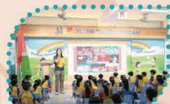
中國體育的發展，讓人倍感自豪！

本校升旗隊於2023-2024年度正式成立，於每週升旗禮中展示出日常學習的升旗禮儀和步操技巧。每月第一個星期三舉行升旗禮儀式後會進行國旗下的講話，由校長及老師從國史、國情、國安及文化等多方面作分享，加強學生認識國家、關心國家，並增強對國民身份的認同。