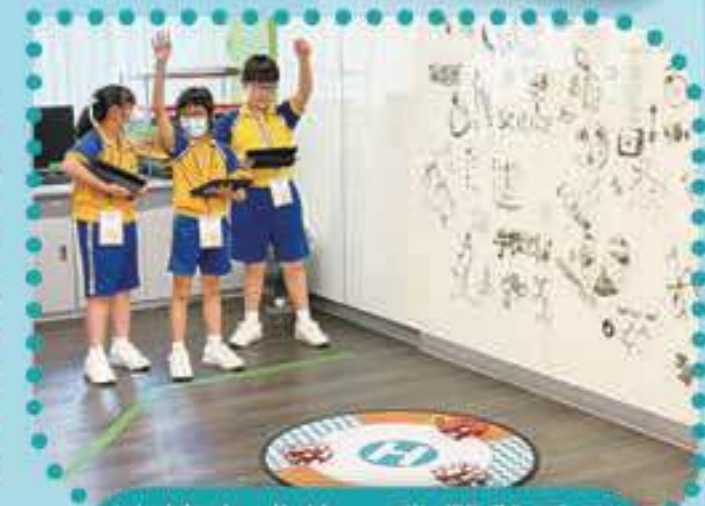
連接完成後，我們舉手示意，準備比賽！