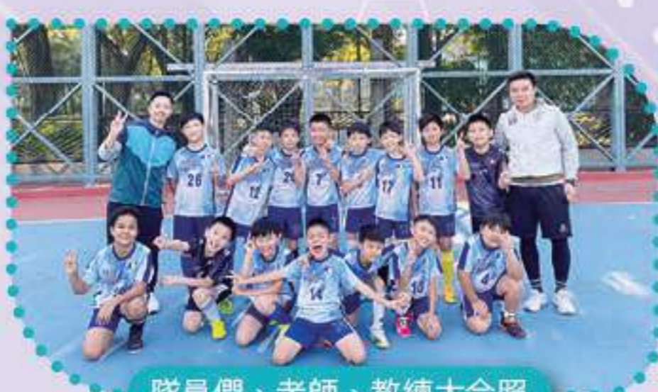
隊員們、老師、教練大合照

本年度足球比賽改為五人制，無論在技術層面和體能要求上都比以往大。在這次比賽中，足球隊雖然未能晉級，但比賽當中累積的經驗也是隊員們在成長路上重要的一環。