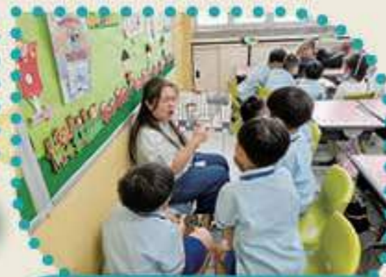
同學們踴躍回應，故事媽媽予以讚賞