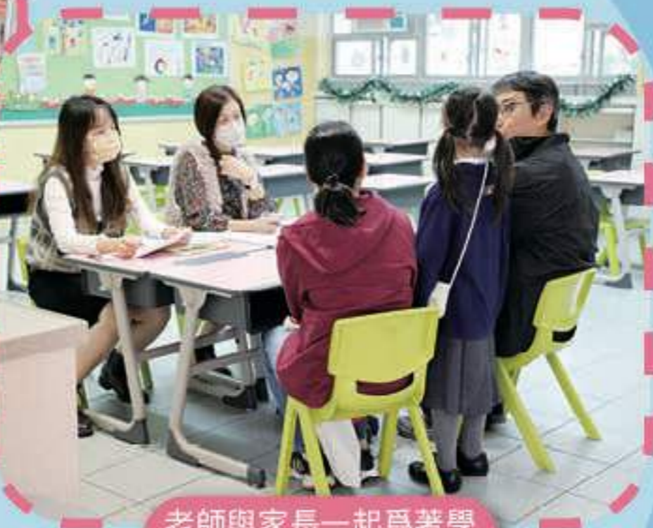
老師與家長一起為著學生的未來努力！