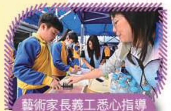
藝術家長義工悉心指導同學繪畫技巧