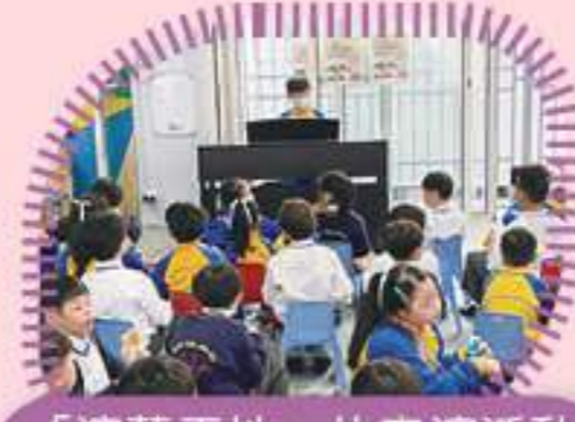
「演藝天地」的表演活動吸引很多觀眾欣賞啊！