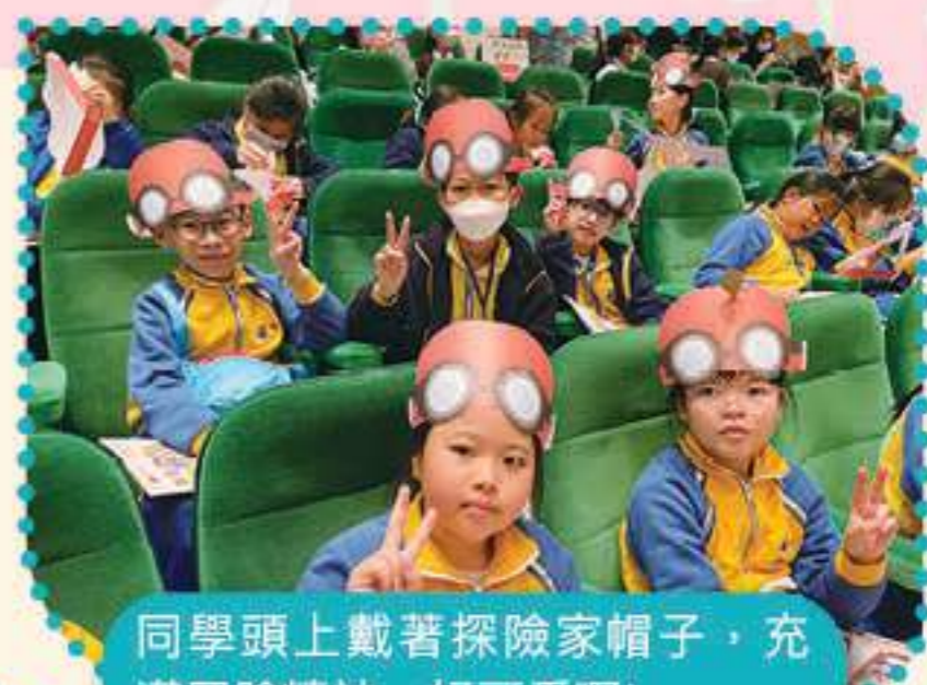
同學頭上戴著探險家帽子，充滿冒險精神，好可愛啊!

四年級全級同學參加了由香港藝術節舉辦的《彼德與狼》導賞會及音樂會(香港文化中心演奏廳)，為同學提供兩場專業的音樂導賞及表演的機會，樂團利用深入淺出的手法，生動有趣地帶出管弦樂團高質的音樂表演，讓同學容易投入及感受濃厚的音樂氣氛。