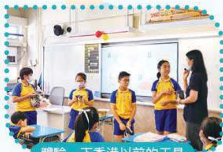
體驗一下香港以前的工具

本年度視藝科參與了賽馬會「敲敲記憶」藝術科技教育計劃，邀請導師到校為六年級的同學介紹香港從鄉村到城市的古今生活文化，讓他們了解更多關於香港的歷史。學生在課堂上更會創作有關的藝術作品以及利用AR動畫參觀香港的傳統建築物。課堂生動有趣，學生更十分投入創作具香港文化特色的作品。