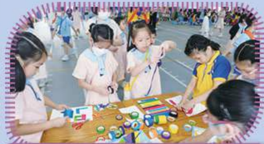
撕撕貼貼，七彩的膠帶拼砌出不同的作品