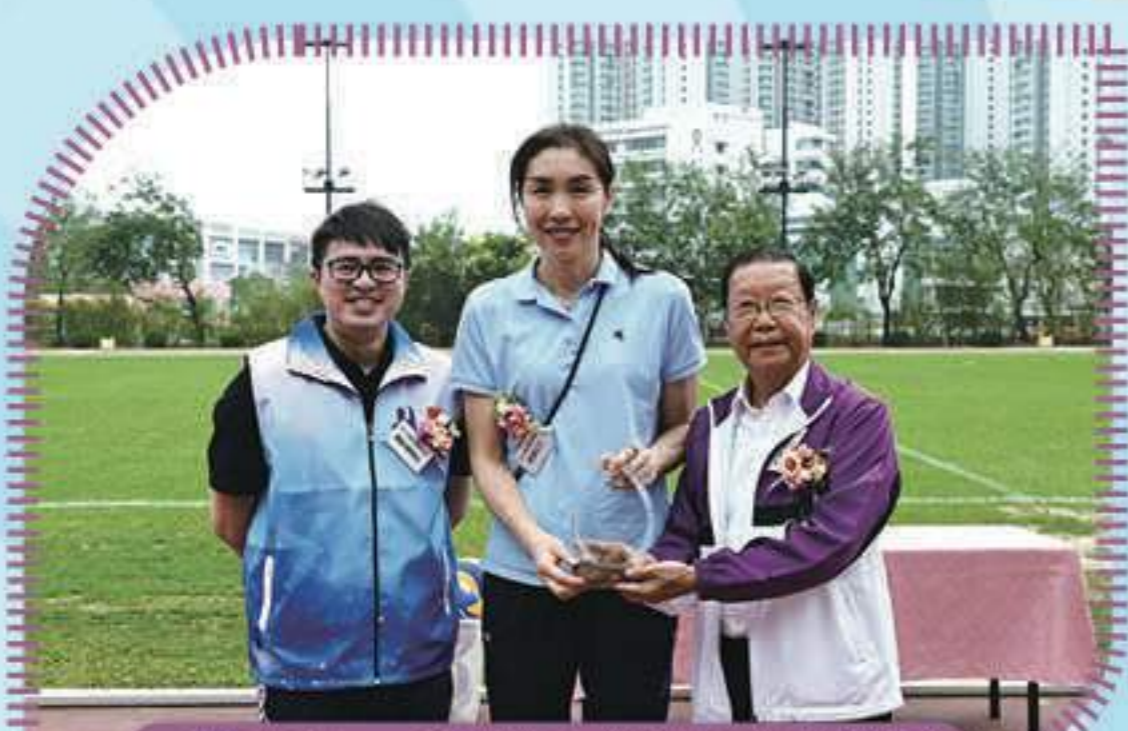
主禮嘉賓——孫玥女士(前中國女排隊長)