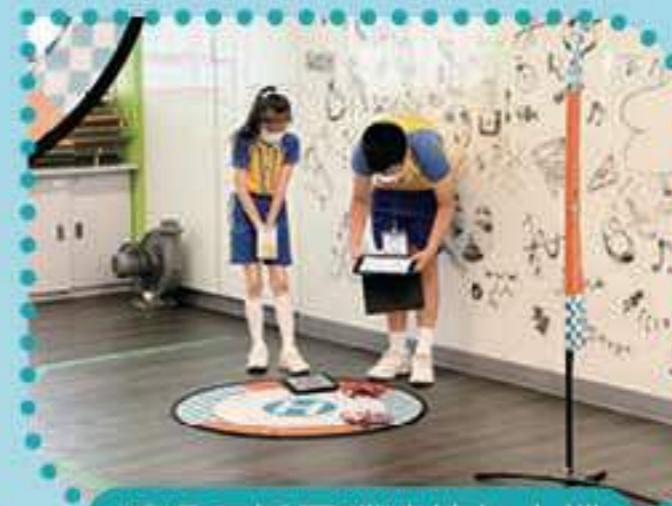
透過平板電腦連接無人機