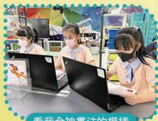
看我全神貫注的模樣