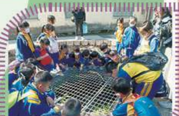
同學們興致勃勃地觀察及研究古井