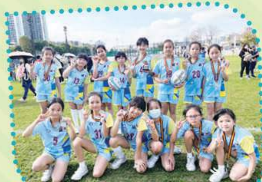
恭喜女子欖球隊在北區欖球賽2024中獲得女子組碗賽亞軍！