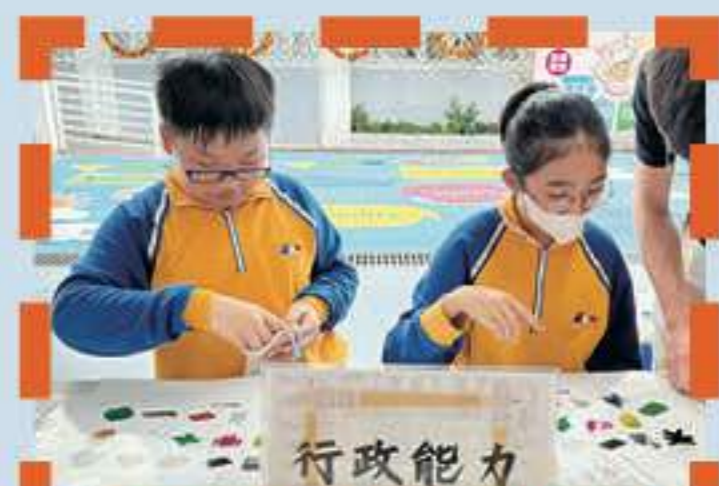
我們在了解不同職業的需求

本校為四至六年級學生開展生涯規劃教育，幫助高小學生認識自己的興趣、性格特點、能力、需要和志向，讓他們對自己未來路向和工作有更寬廣的看法，並從中培養學生積極正面的學習和生活態度。