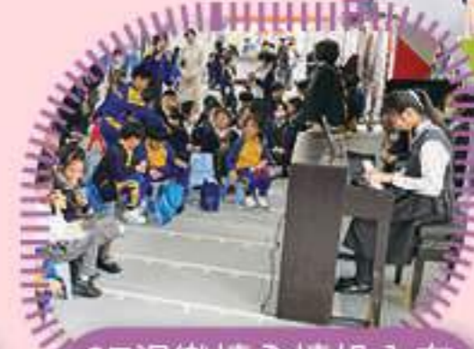
6E溫樂情全情投入在鋼琴表演中，讚！