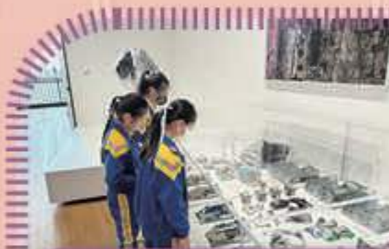
原來電子零件的構造和外觀是這樣的!