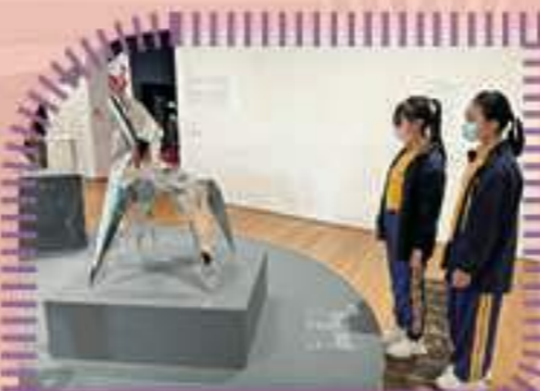
每個展品都獨一無二呢!

此外，學生們更可在工作坊中嘗試以不同的立體模型設計一輛汽車和一張椅子作承重測試。過程中，學生投入活動，透過合作和不斷嘗試，最後通過測試。是次參觀活動既擴闊了學生對STEAM的了解，亦提升了他們學習STEAM的興趣。