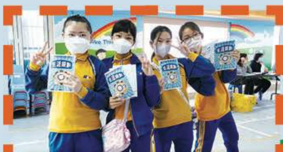
生涯規劃體驗活動讓我們獲益良多呢！