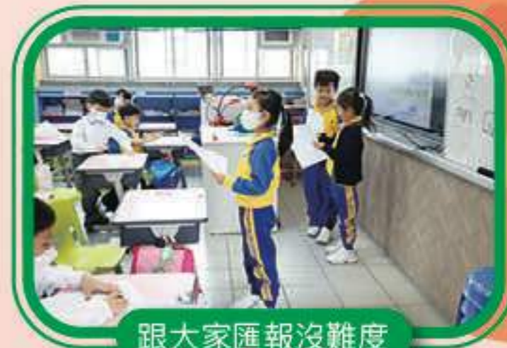
跟大家匯報沒難度