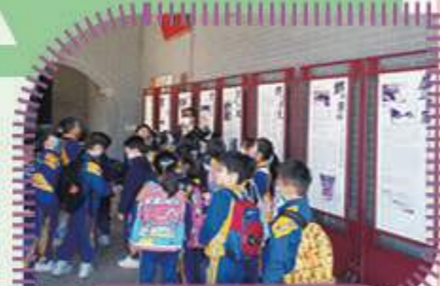
他們對於宗祠的建築特色十分好奇