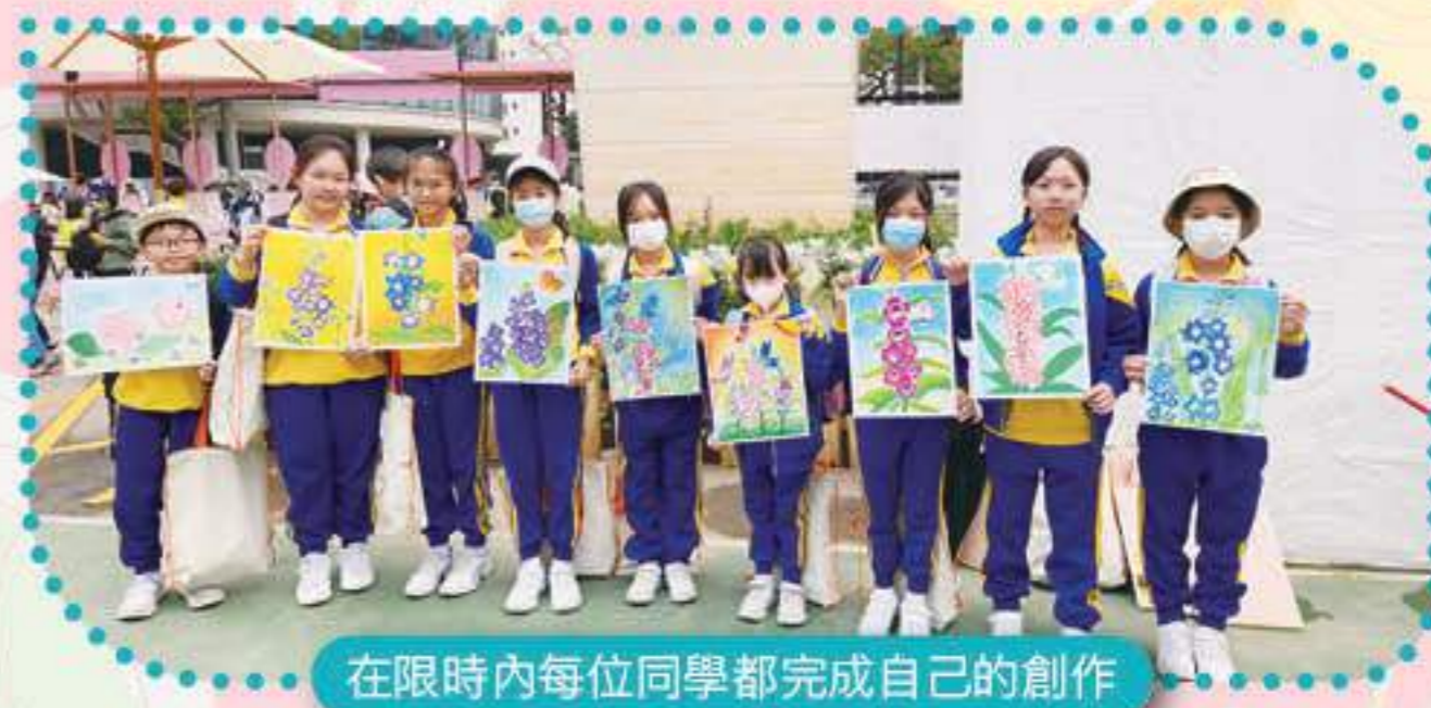
在限時內每位同學都完成自己的創作