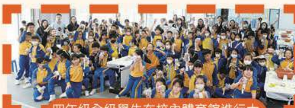
四年級全級學生在校內體育館進行大課——種植活動