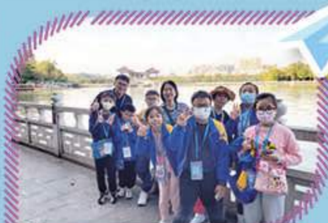
我們與校長在西湖的合照