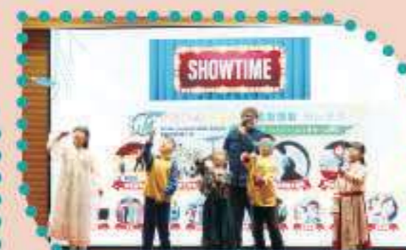
我們都是雜耍小能手！