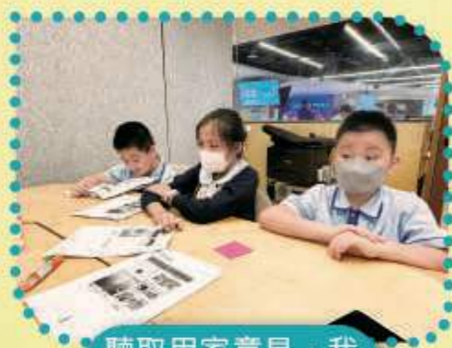
聽取用家意見，我們會繼續完善！