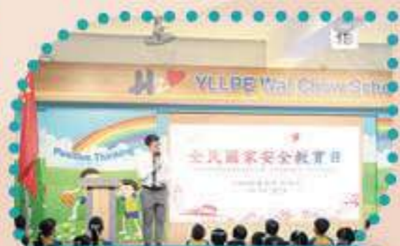
國家安全，才是穩定繁榮的基石