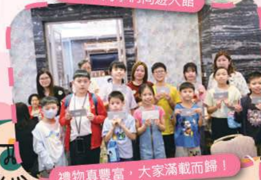
禮物真豐富，大家滿載而歸！