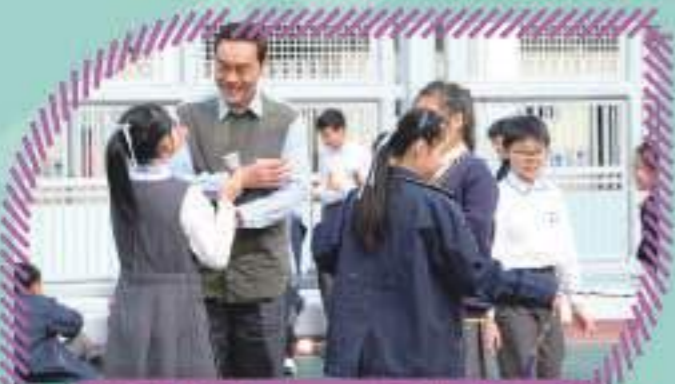
拍攝過程中，同學們主動與影帝劉青雲先生聊天

這次拍攝活動讓學生體會電影拍攝的龐大陣容和過程，為學生帶來特別及珍貴的學習體驗。