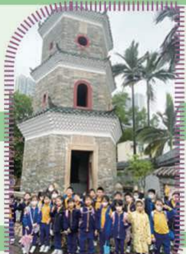
同學們於聚星樓前訂立新一年學習的目標

為了讓學生認識香港傳統特色及文化，圖書組於2023年11月3日及4日安排二年級學生參觀屏山文物徑，並配合圖書冊進行學習。參觀首天，陰鬱的天氣無礙學生好學之心，同學們在風雨中仍專注聆聽導賞員講述的歷史故事，過程中同學們爭相踴躍發問，更於聚星樓前效法古人勤學的美德，訂立了新一年的學習目標。