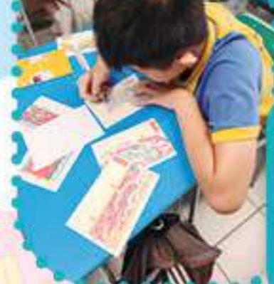
歷史建築物上的紋飾有著不同寓意，學生正在創作具文化特色紋飾的心意卡