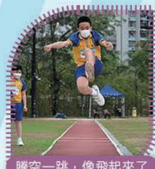
騰空一跳，像飛起來了