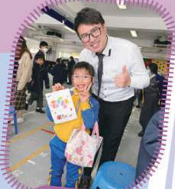
校長也來參與藝術創作活動