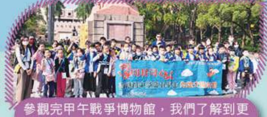
參觀完甲午戰爭博物館，我們了解到更多有關這段歷史的情況