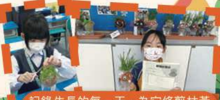
記錄生長的每一天，為它修剪枯黃的枝葉