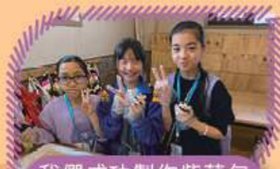
我們成功製作紫菜包飯，好好味！