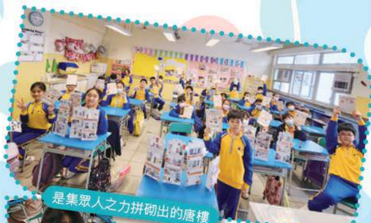
是集眾人之力拼砌出的唐樓