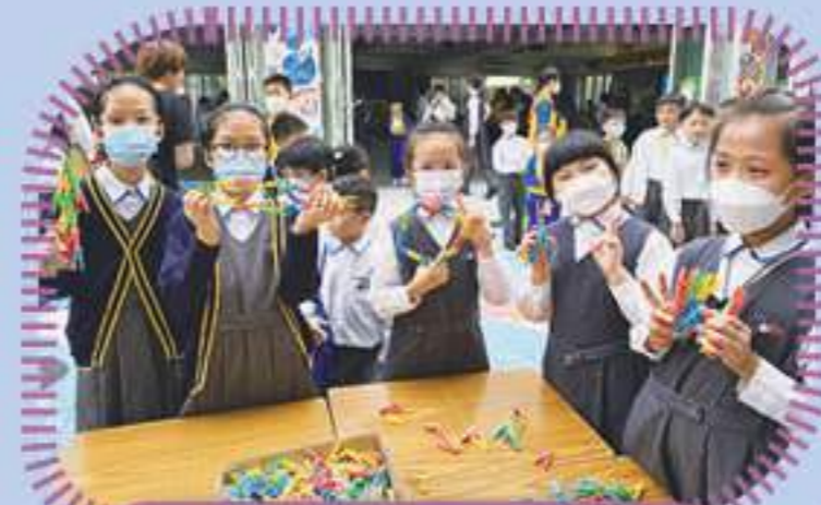
即使用相同的材料，我們也有不同的創意作品