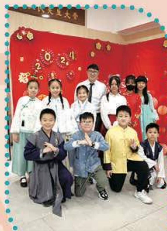
用心才能寫出一手好字！

本校在二月舉辦了「中華文化日」，本年的主題為「中國古代傳統民間師傅工藝」，這天讓學生了解到各種世代相傳的工藝製作過程。當天的攤位活動加入了不少讓學生親身體驗和實踐的環節，讓他們充分感受到中國人傳統智慧的奧妙；禮堂進行了傳統雜耍表演——「水流星」，表演嘉賓精湛嫻熟的技術，讓師生們嘆為觀止、拍案叫絕。經歷了整天的活動，同學們無不感嘆中國傳統藝術文化的博大精深。