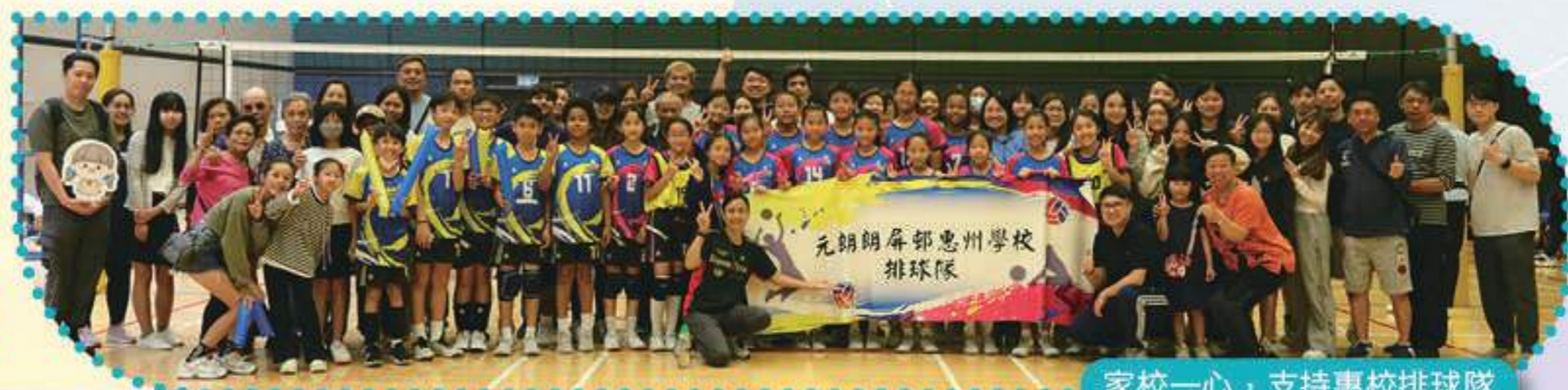
家校一心，支持惠校排球隊