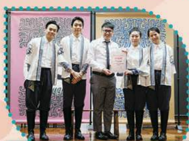
7A班戲劇組的演員與鄭校長合照留念

六年級學生參加了7A班戲劇組主辦的「賽馬會『趣看文言』戲劇教育計劃」，欣賞劇本《楊修之死》。當日活動相當精彩，學生的反應熱烈。演員們以深入淺出、生動有趣的手法令原本艱澀的文言文「活」起來，讓學生更易掌握篇章內容，提升他們閱讀文言文的興趣。