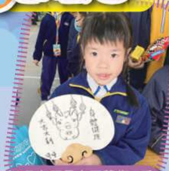
2月主題是中國藝術—手繪紙扇，學生用心繪畫配合賀年氣氛的紙扇

為了豐富學生的藝術體驗，視藝科於小息時段舉辦了「遊藝園」藝術創作活動，每月設不同媒介的主題攤位及白板創作區，邀請本校具藝術素養的家長義工協助籌備及推行。同學們熱愛藝術，踴躍參與。