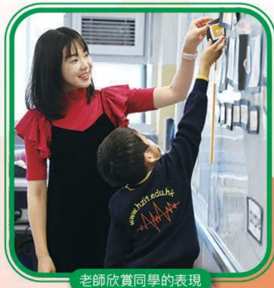
老師欣賞同學的表現