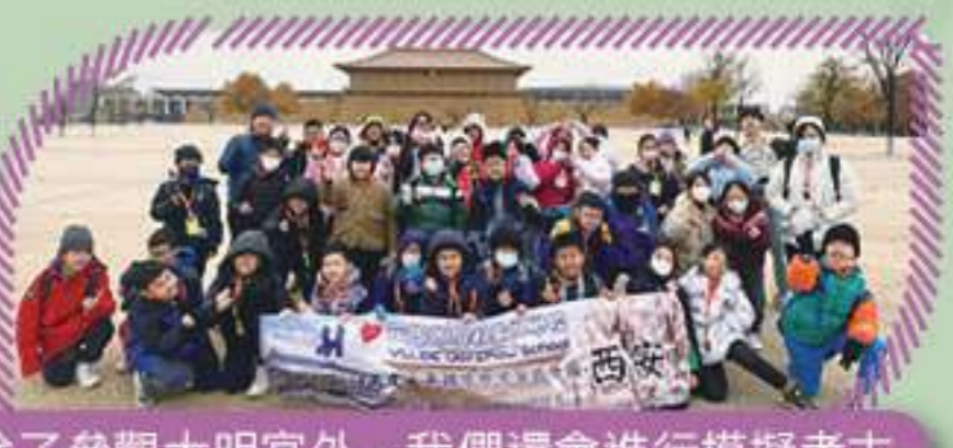
除了參觀大明宮外，我們還會進行模擬考古