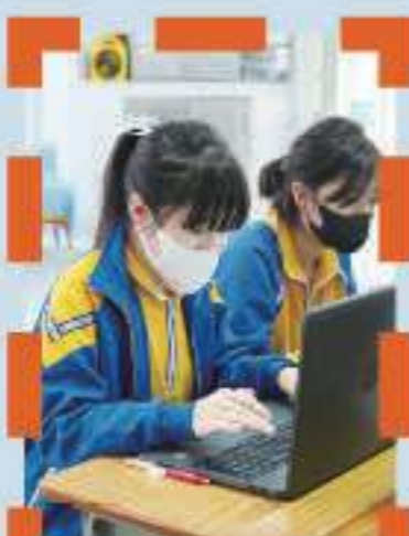
我正在學習文書處理呢！