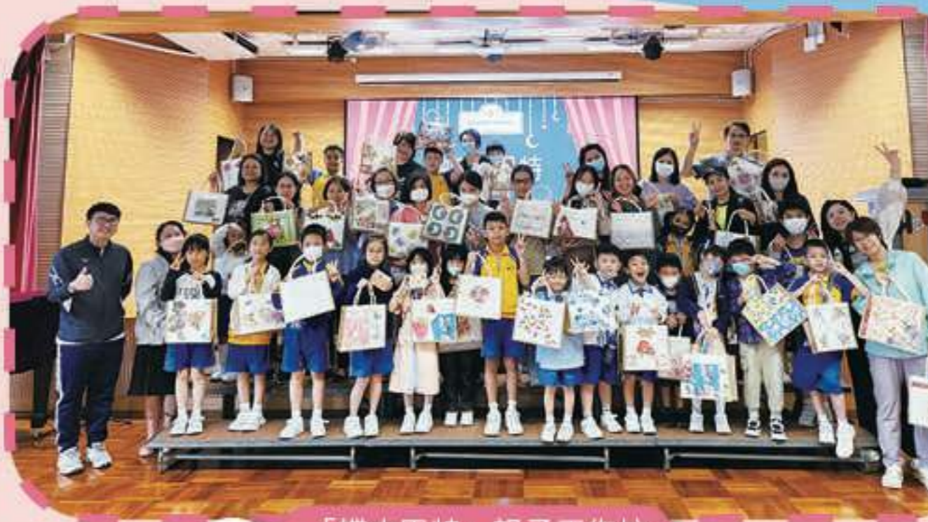
在互相幫助下，大家都成功扭出寶劍啦！

本校與東華三院何玉清教育心理服務中心合辦「家校齊家教」家長課程，旨在協助家長認識兒童情緒及社交發展階段的需要及挑戰，提升家長在親子關係中的能力及信心。課程是由瑪麗醫院兒童及青少年精神科團隊依照心理健康框架所制定，包括一系列的家長講座、工作坊、小組及親子活動，讓父母在管教的路上有更全面的準備。