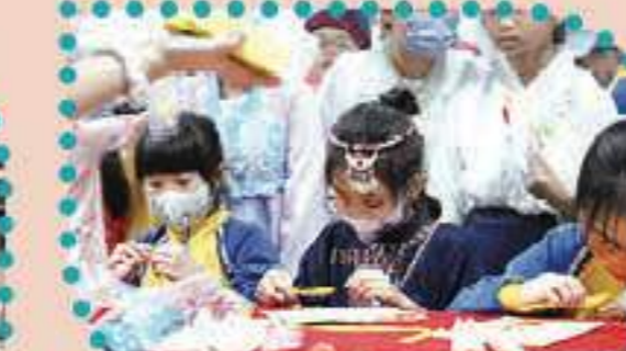
我們認真地參與攤位活動！