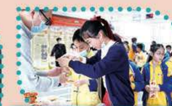
麥芽糖餅的製作必須小心翼翼！