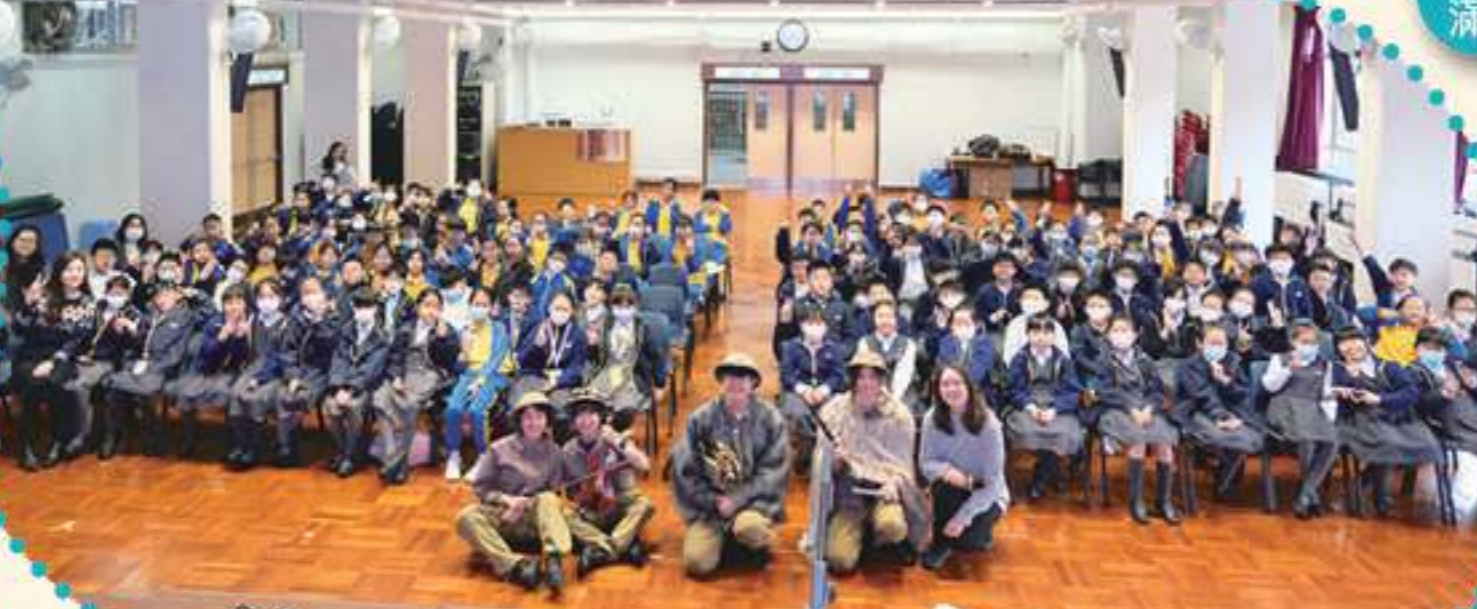
《彼德與狼》導賞會於本校禮堂影大合照