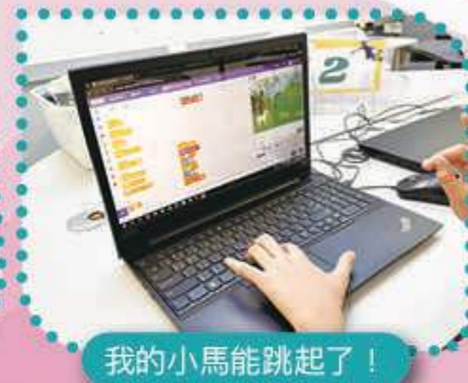
我的小馬能跳起了！