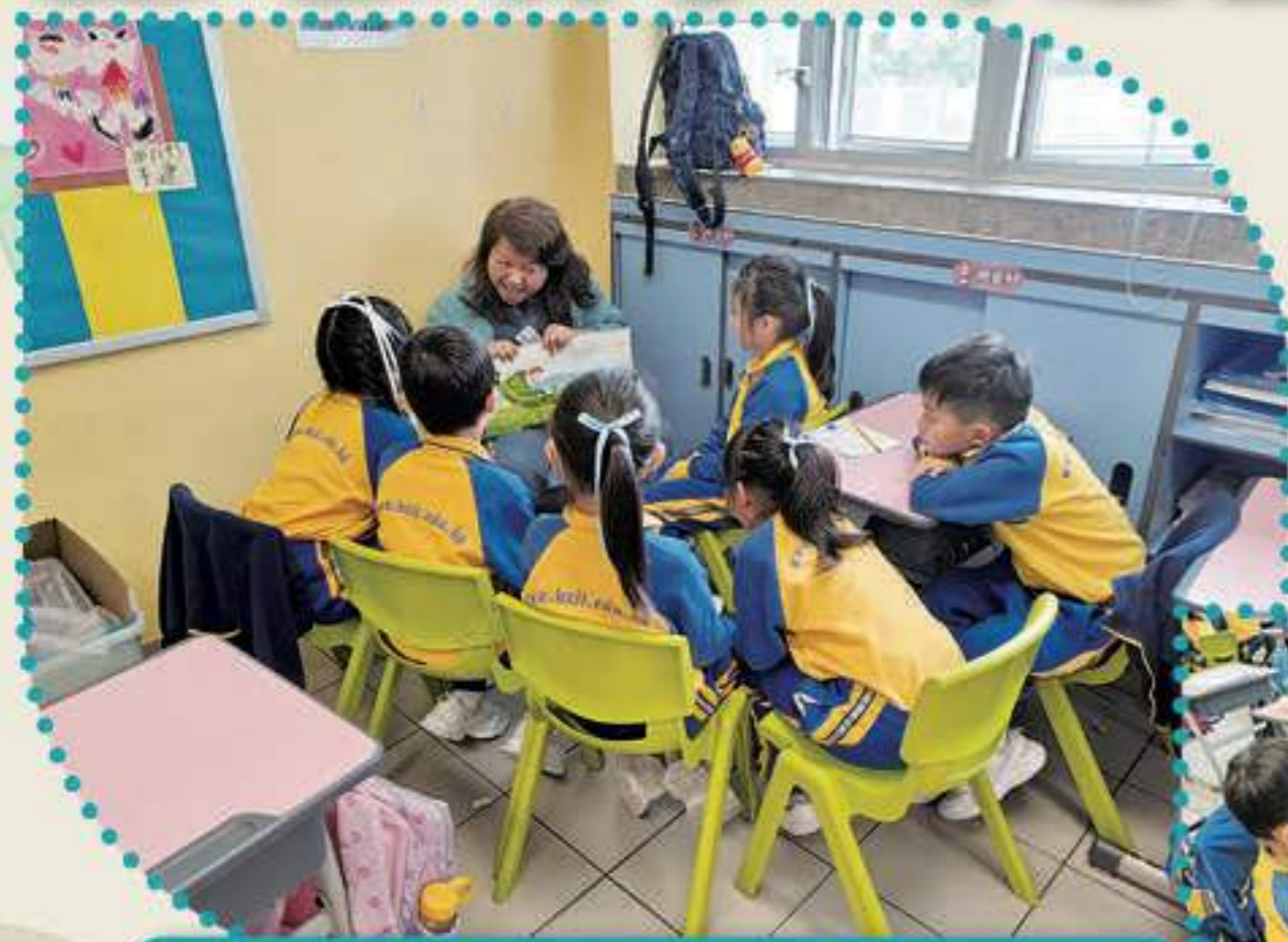
故事媽媽表情豐富，精彩的表達方式，讓學生陶醉

為營造校園閱讀氛圍，提升學生閱讀興趣。本年度圖書組邀請了數位熱心的家長，組成「故事爸媽」團隊，於小息為一年級的學生講故事。感激家長們的無私付出，同學們十分期待每次活動，並專注認真地聽故事，閱讀量亦有所提升。