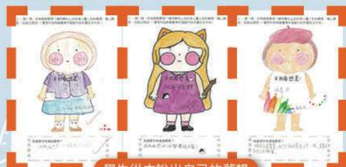
學生從中說出自己的夢想

本校為四至六年級學生開展生涯規劃教育，幫助高小學生認識自己的興趣、性格特點、能力、需要和志向，讓他們對自己未來路向和工作有更寬廣的看法，並從中培養學生積極正面的學習和生活態度。