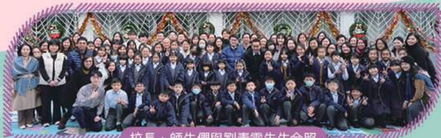
校長、師生們與劉青雲先生合照