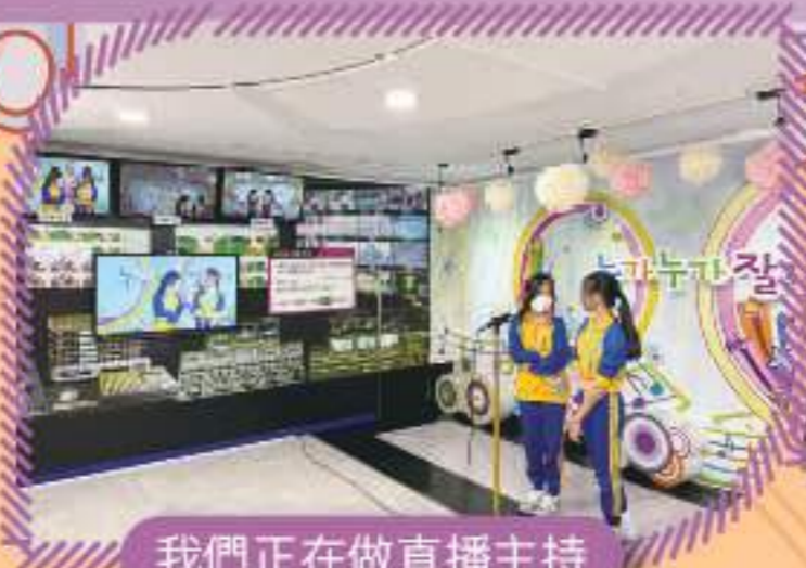
我們正在做直播主持

2024年4月，本校六年級同學參加了韓國遊學之旅，整個旅程學生除了參觀空中花園、KBS電視台、韓屋村、科學館、首爾塔等不同景點外，還穿上韓服和製作紫菜包飯，體驗韓國人的生活，認識韓國傳統文化。