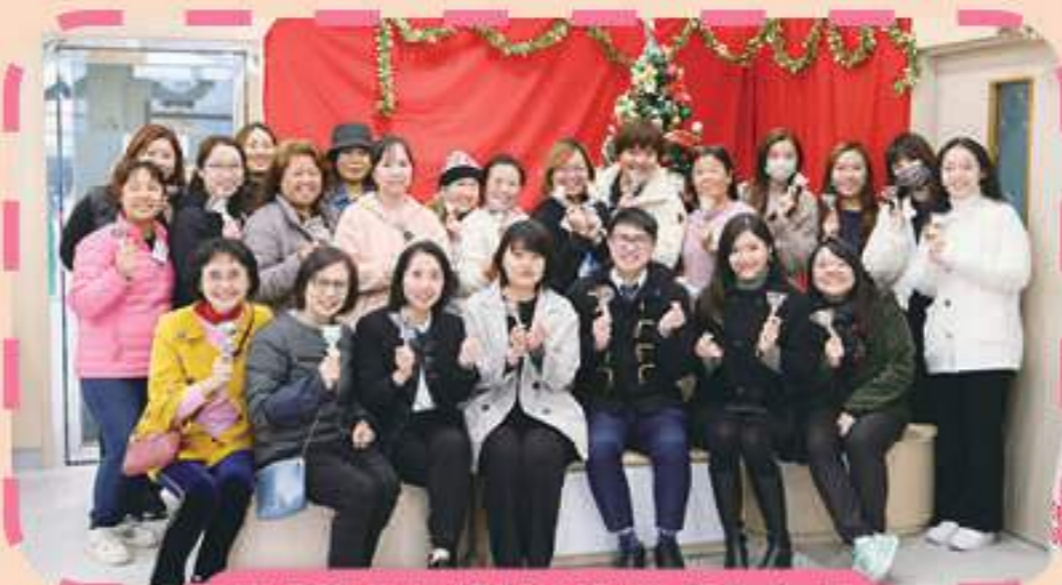
校長和老師們都收到家長的心意