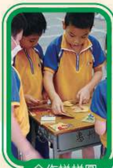
合作拼拼圖，你我都出一分力