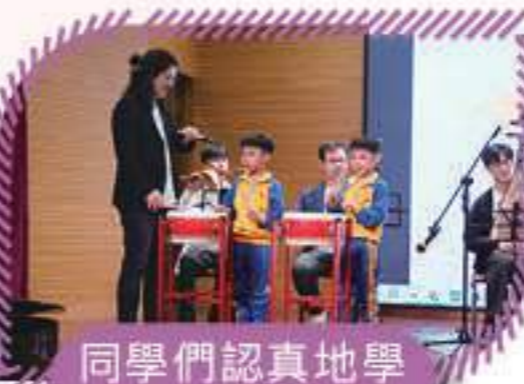
同學們認真地學習中國鼓樂