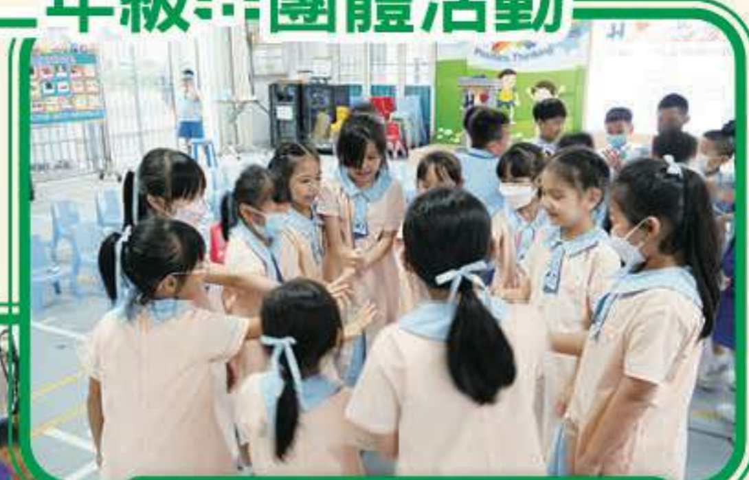
透過小組合作活動，提升班內的凝聚力