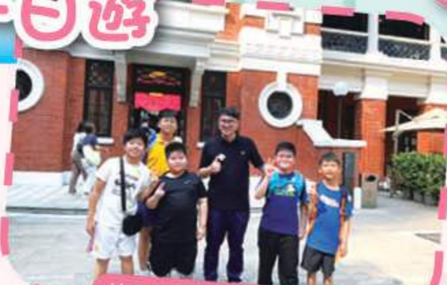
校長與同學們同遊大館

當天天氣晴朗，是出遊的好日子。我們先到山頂體驗纜車之旅，讓大家欣賞美麗的城市風景，遊覽山頂廣場及舊山頂餐廳，了解山頂的歷史文化和風貌。下午時段，大家一起到舊中區警署——中環大館參觀，這是中上環區的歷史古蹟，館內的舊監獄場景令家長和小朋友印象深刻，周圍的藝術展覽充滿文藝氣息，大家都在歡笑聲中度過了愉快的一天。