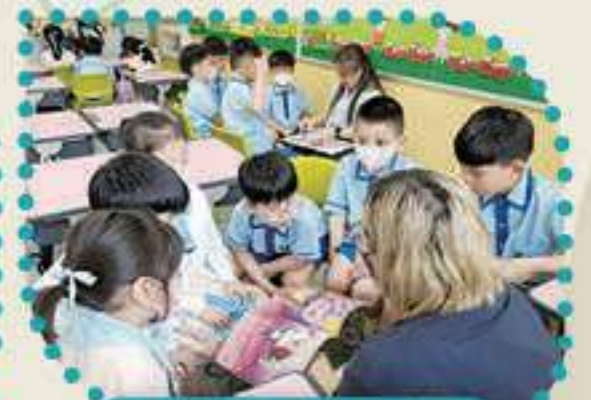
沉醉於故事海洋裏