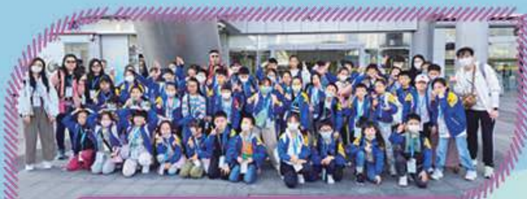
我們已抵達內地了，我們會用心學習啊