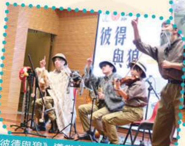
《彼德與狼》導賞會，樂手演出生動有趣