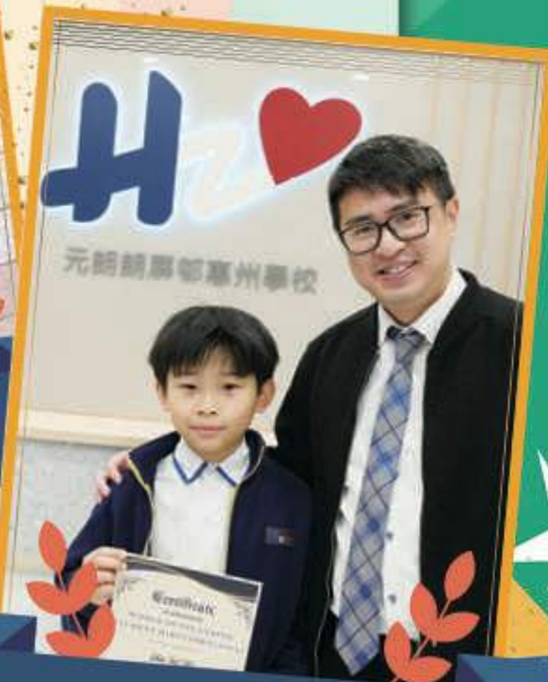
校長和浩庭都感到十分高興！