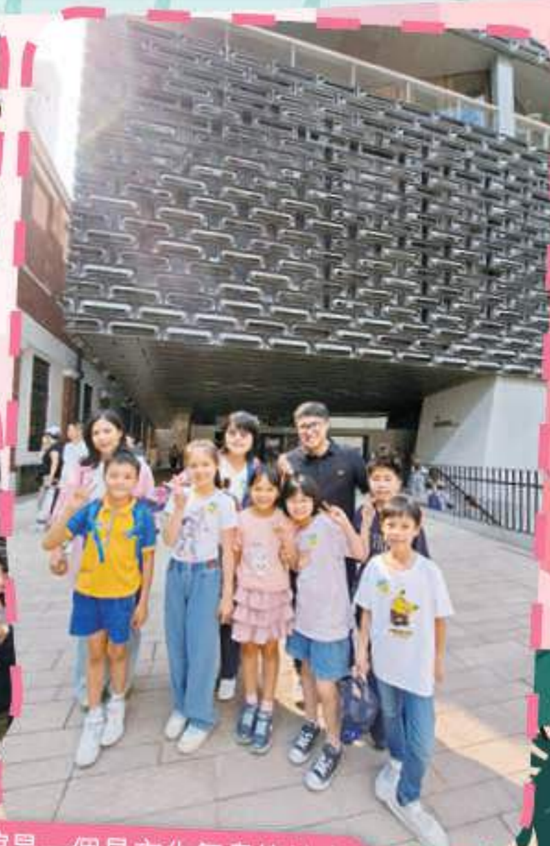
大館是一個具文化氣息的地方