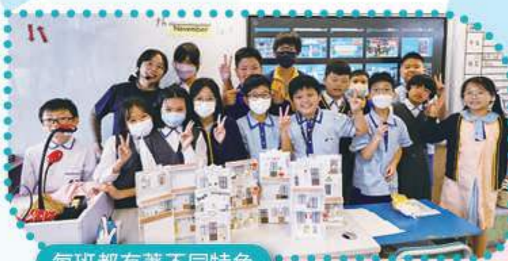
每班都有著不同特色