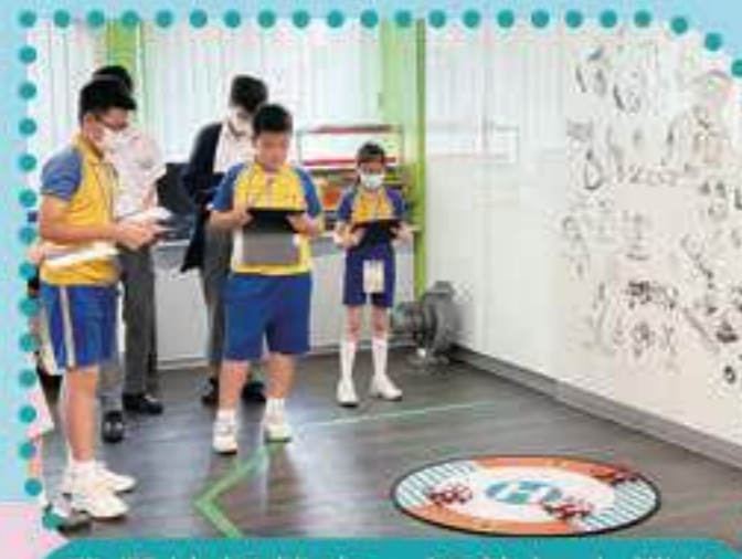
我們按部就班，調整無人機起飛的位置，避免互相干擾