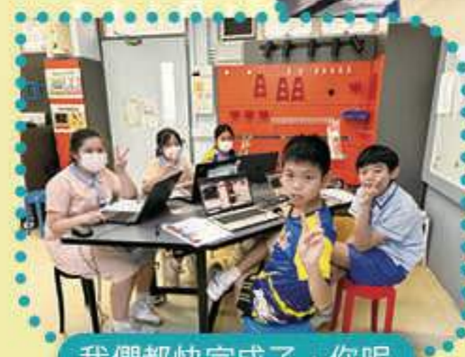
我們都快完成了，你呢