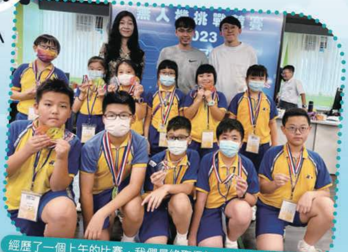
經歷了一個上午的比賽，我們最終取得無人機團體全場總冠軍