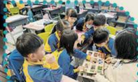
同學們熱烈地參與其中