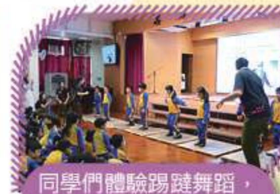
同學們體驗踢躡舞蹈，感覺很有趣