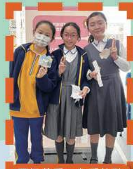
互相尊重，友愛共融