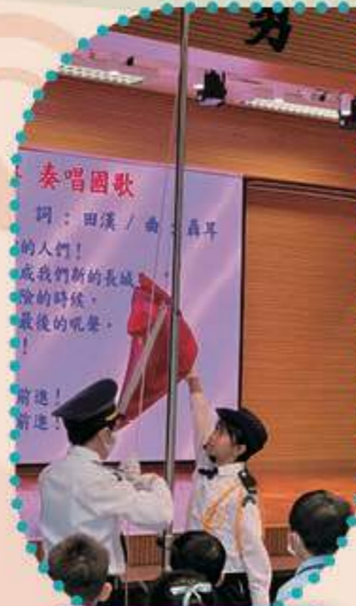
升旗禮儀式進行中