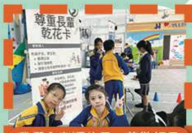
我們會孝順父母，尊敬師長

透過攤位活動，讓學生加深對價值觀：責任感、誠信及尊重的認識，培養「誠懇厚道 盡心盡力 待人禮 盡善盡美」的好品格。