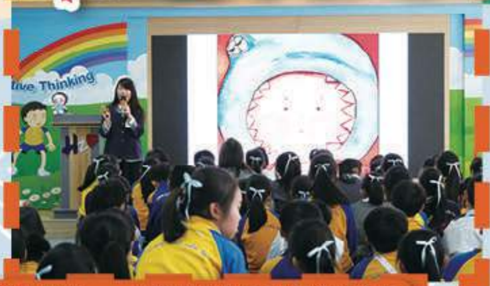
繪本作家——小胖到校為同學們進行分享