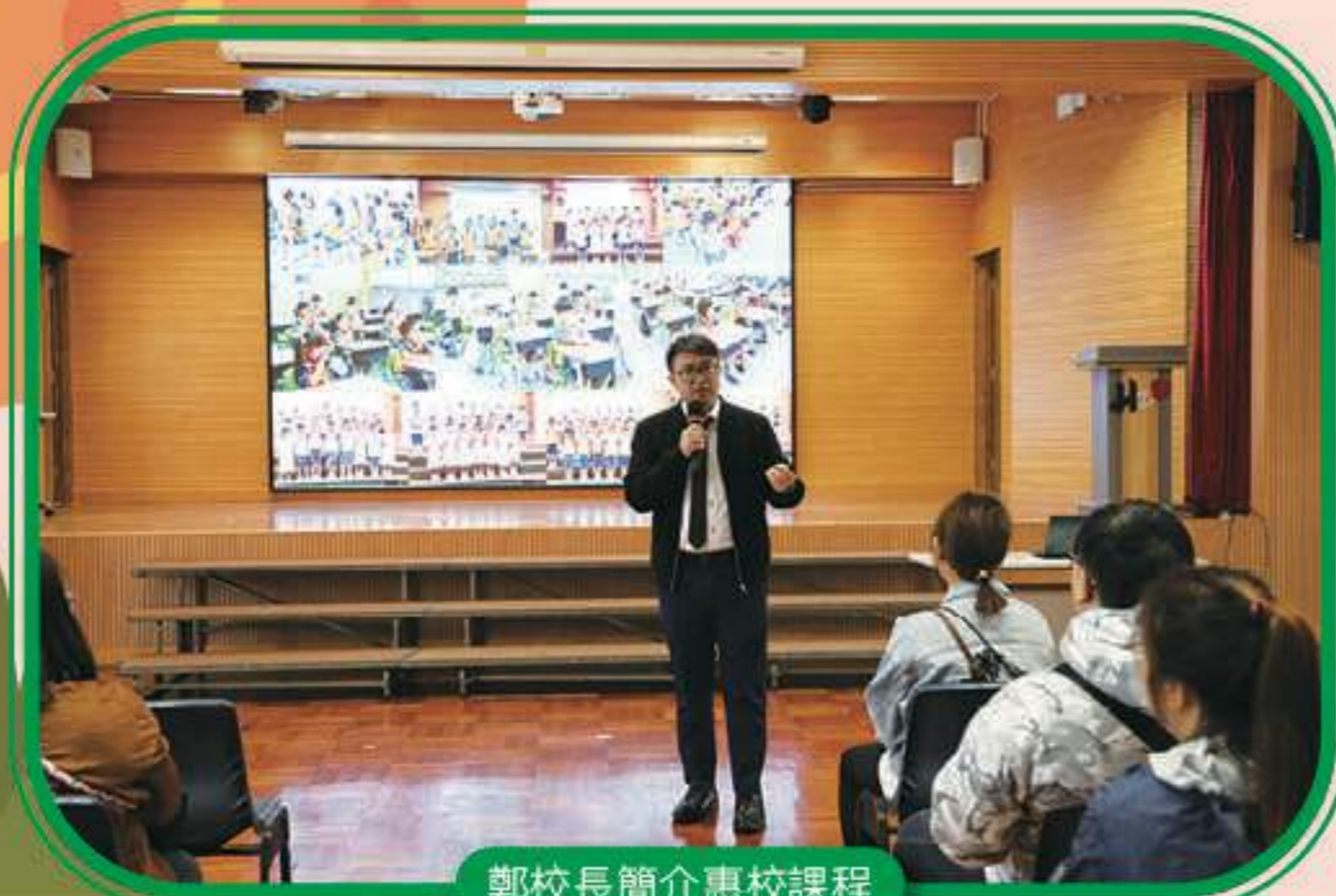
鄭校長簡介惠校課程