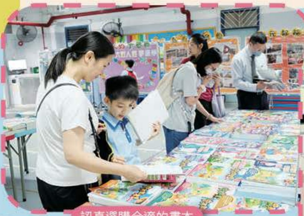
認真選購合適的書本