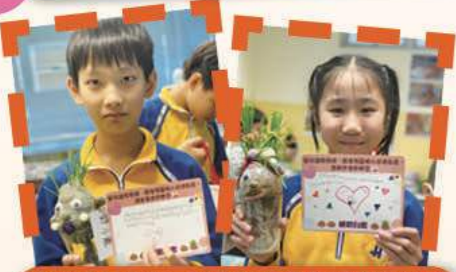
透過繪本故事，讓學生反思生活中默默照顧自己的人，並為他們寫上心意卡