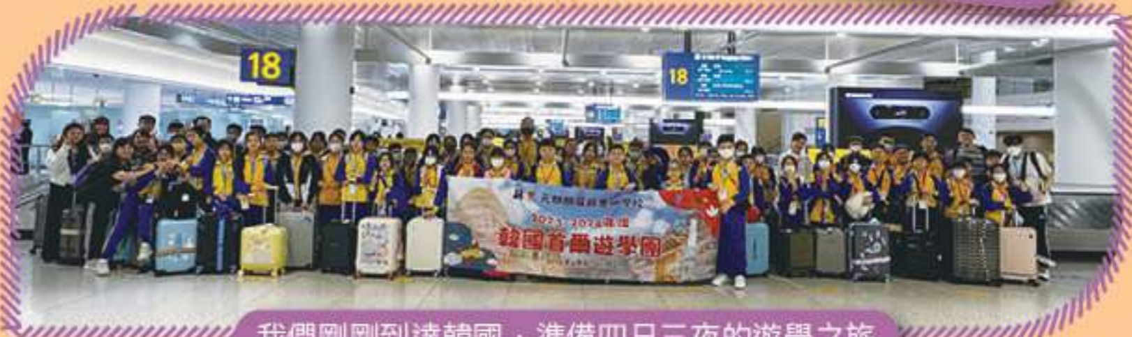
我們剛剛到達韓國，準備四日三夜的遊學之旅