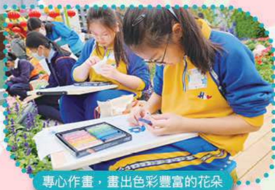
專心作畫，畫出色彩豐富的花朵