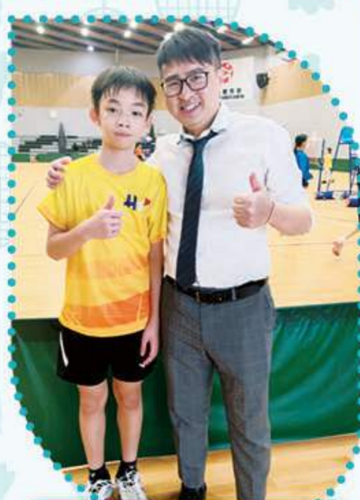
鄭校長到場支持，順利奪冠！